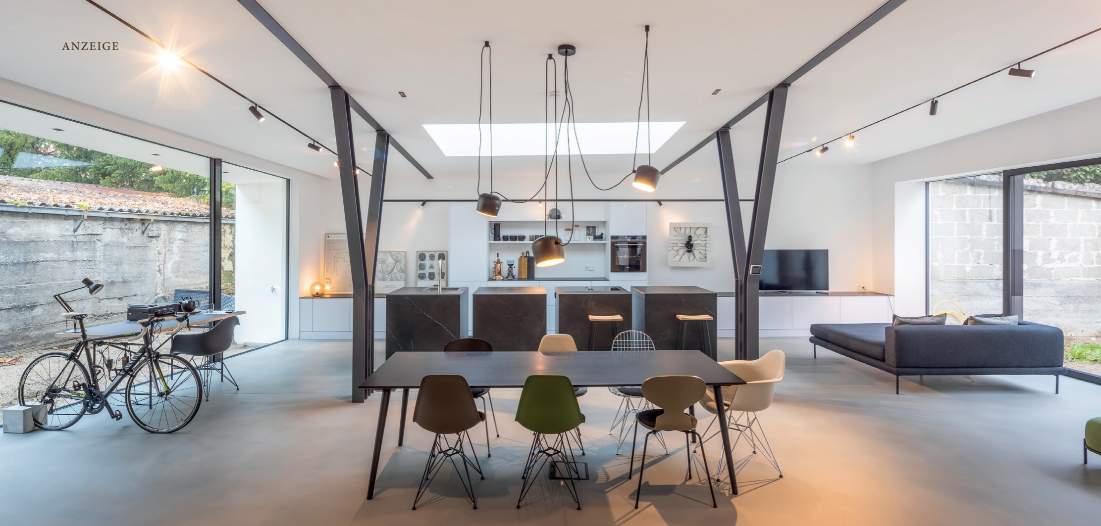
Ansicht Ess- und Wohnbereich mit Küche