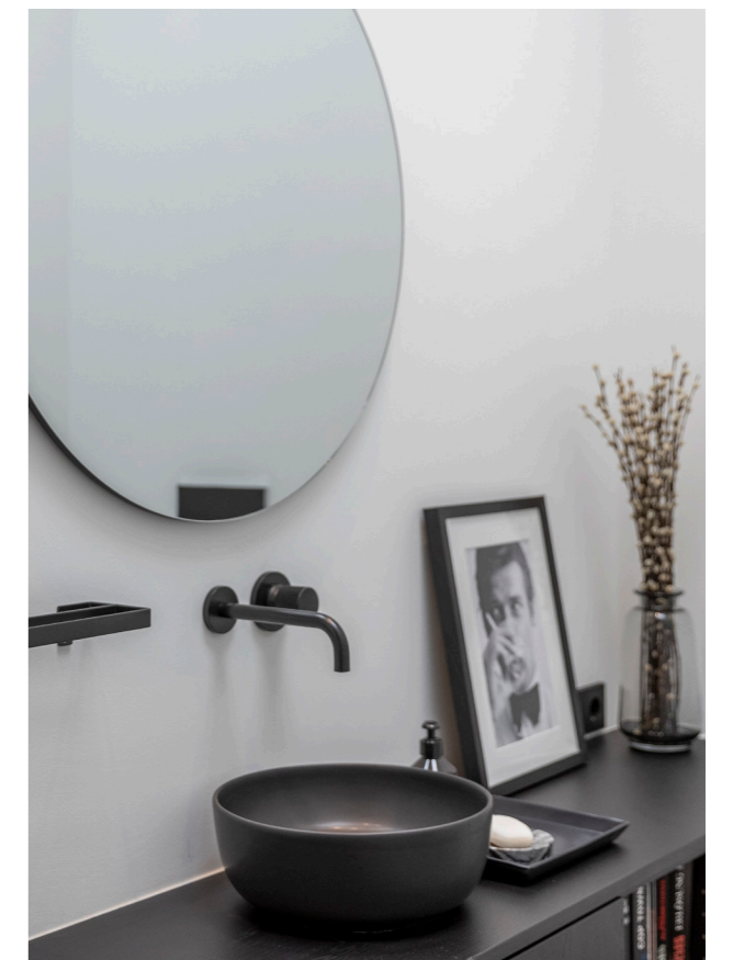
Gehobenes Design bis ins Detail