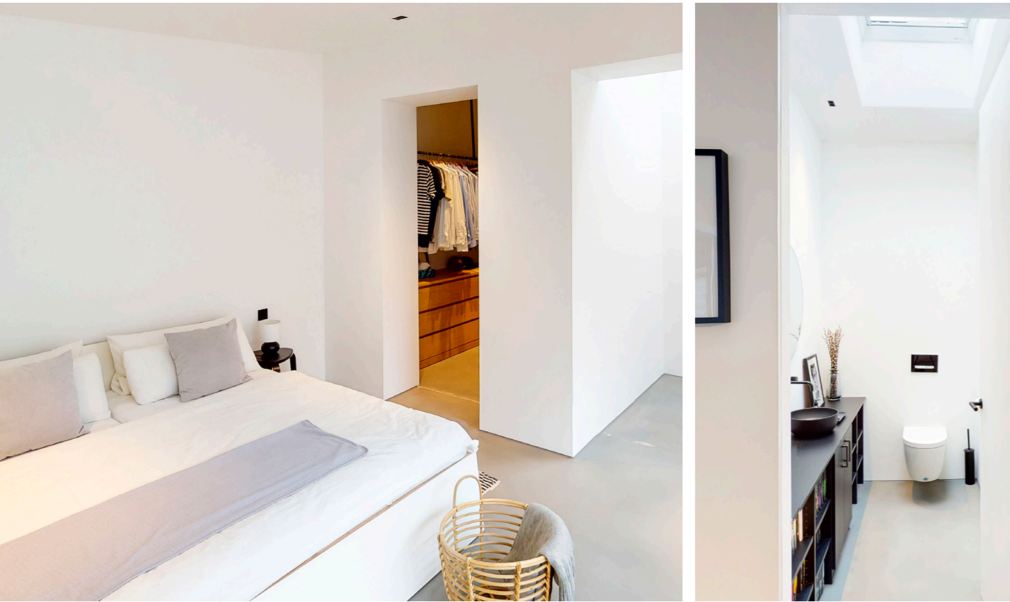
Schlafzimmer mit begehbarem Ankleideraum ...