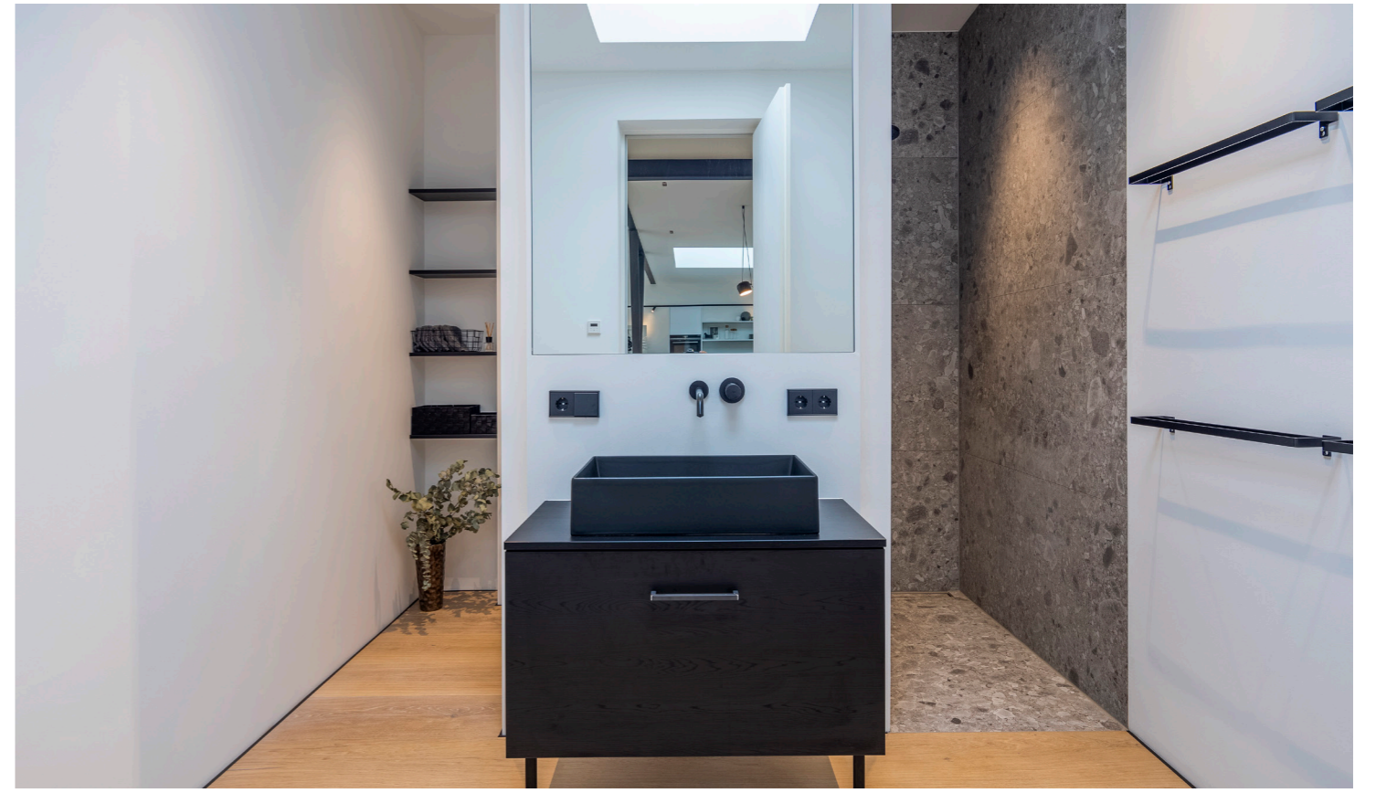
Puristisches Waschzimmer mit Purnatur-Eichenholzdielen ...