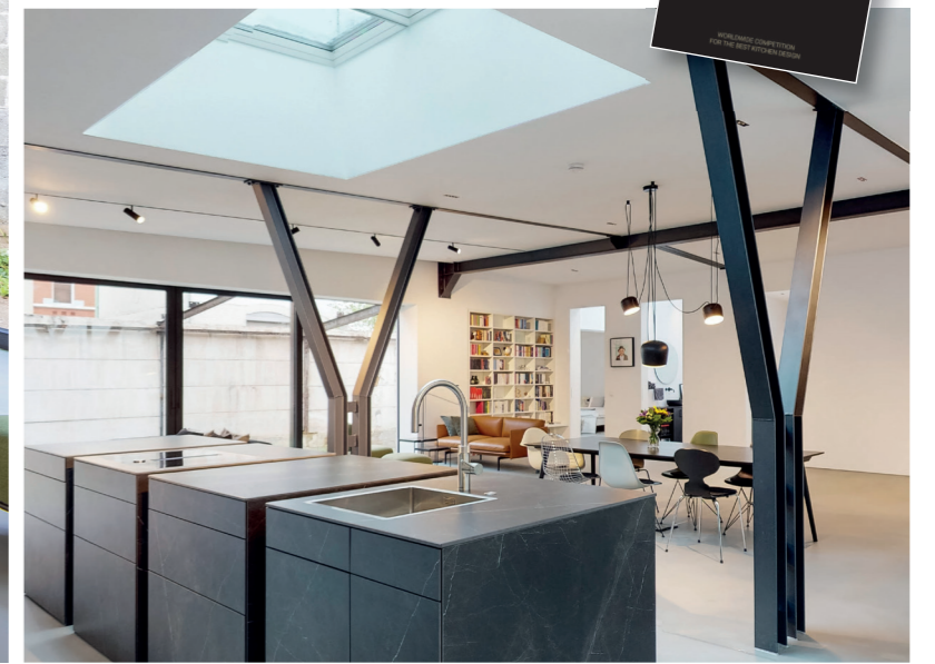
Blick in Richtung Schlafzimmer und Bad