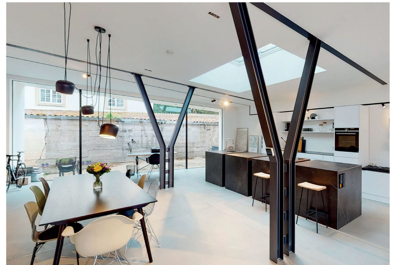
Die Innenarchitektur des Lofts ist von rauen Materialien wie Beton und Stahl in Kombination mit den makellos weißen Wänden geprägt, seine definierten Linien kennzeichnen das Gestaltungs-Konzept – Ansicht zur Westseite.